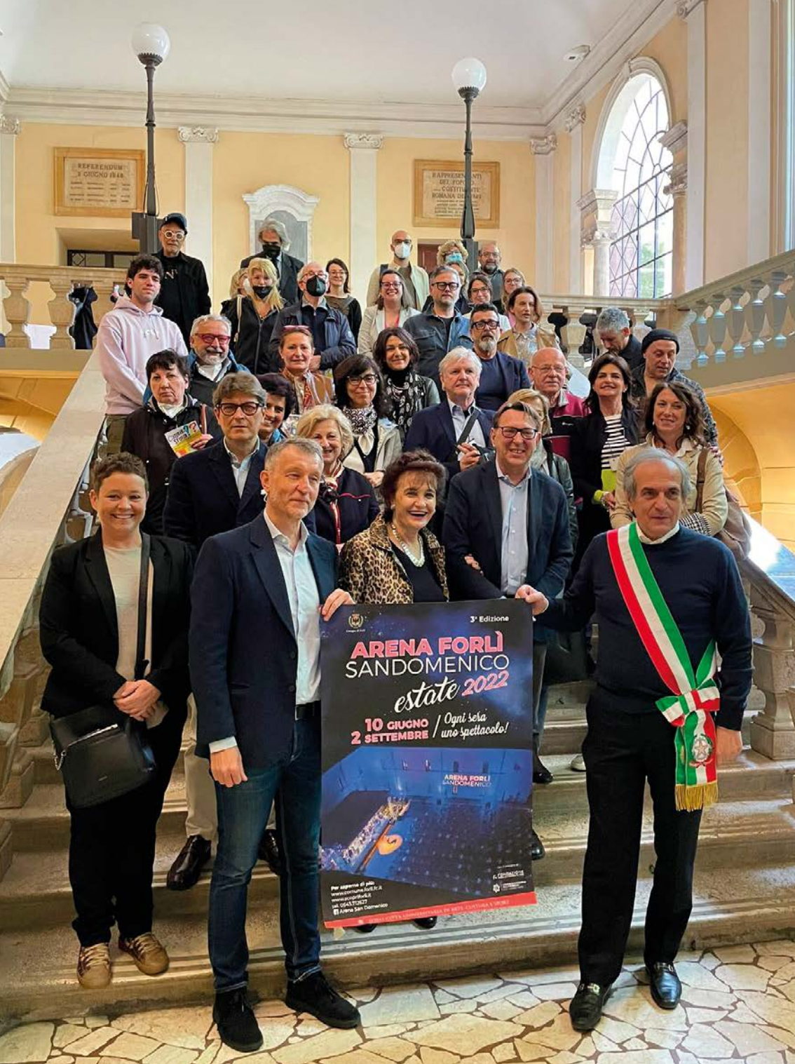
Momento della conferenza stampa con alcuni dei soggetti organizzatori presenti - 2 maggio 2022